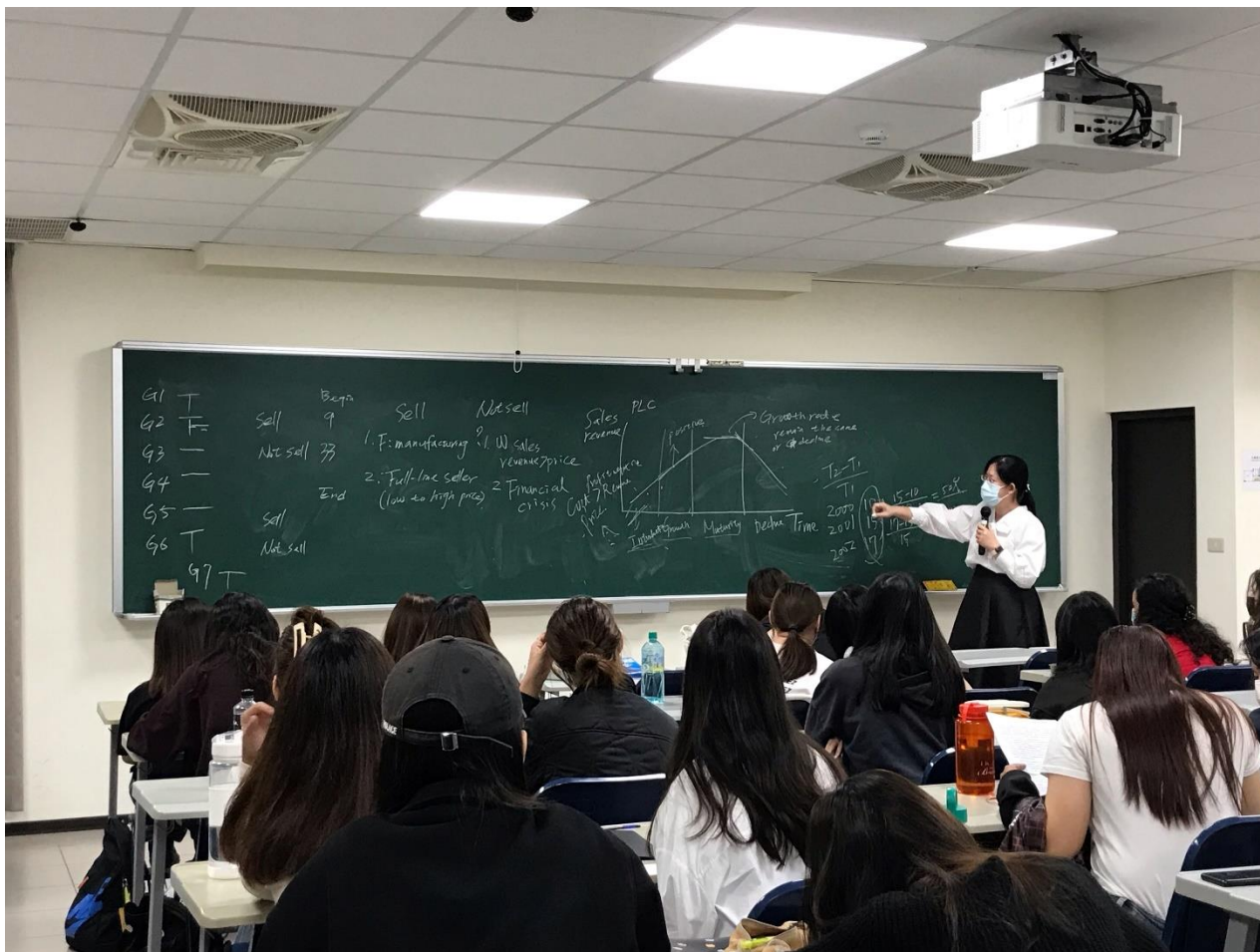
下面照片是討論個案時，同學舉手回答的情形。