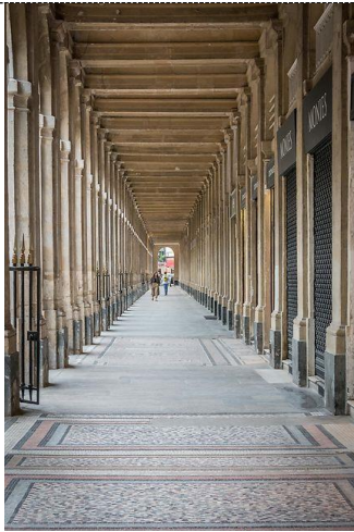
課堂活動景點線上參觀