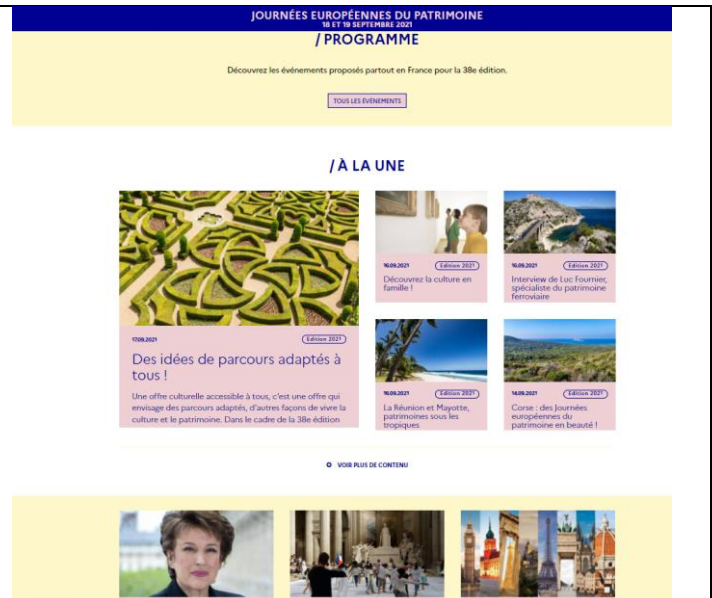
教材：歐洲文化遺產日教材