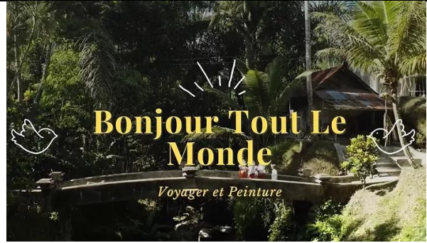
學生作品：各組文化之旅