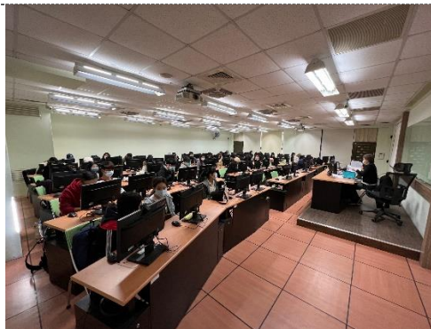
同學聆聽各組成果報告