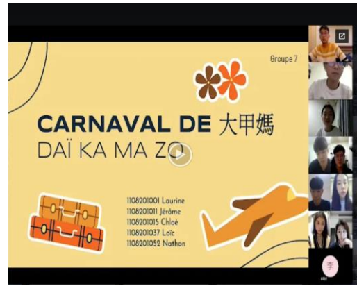
課程活動：線上新聞