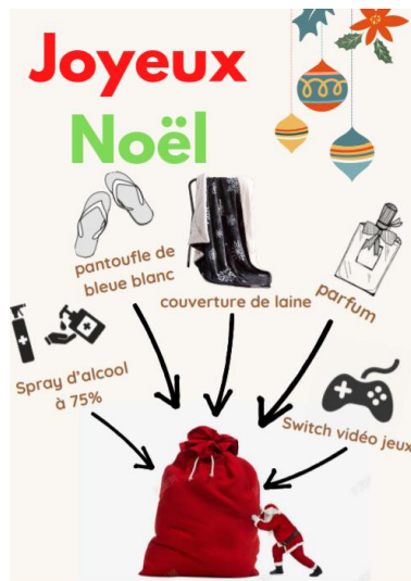
學生作品： 聖誕禮物捐贈給弱勢族群或慈善團體