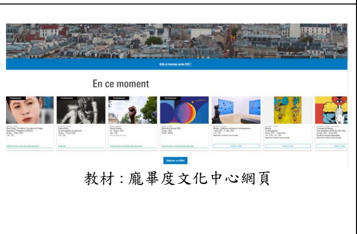
教材：龐畢度文化中心網頁