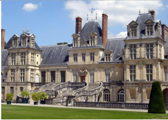
課堂活動景點線上參觀