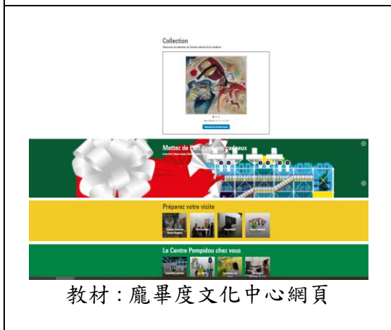
教材：龐畢度文化中心網頁