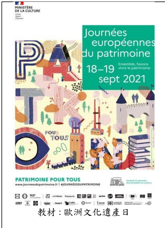
教材：歐洲文化遺產日