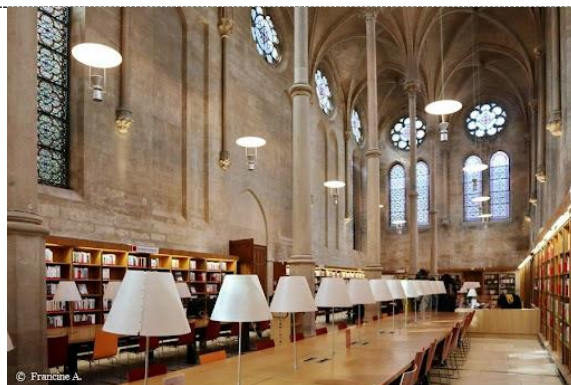
文化遺產活動線上參觀