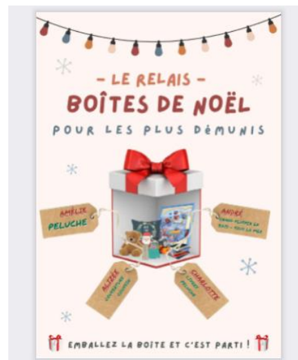
學生作品： 聖誕禮物捐贈給弱勢族群或慈善團體