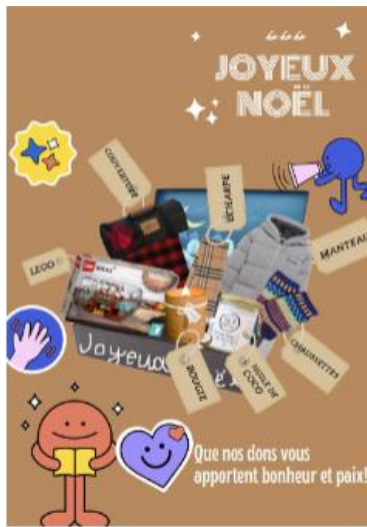
學生作品： 聖誕禮物捐贈給弱勢族群或慈善團體