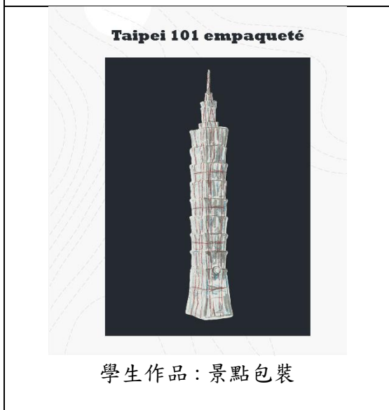
學生作品：景點包裝