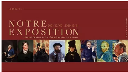
學生作品： 各組主題畫展線上展