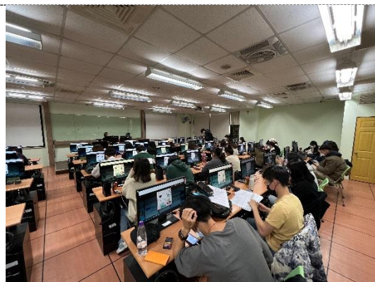
同學聆聽各組成果報告